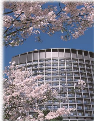
遠方からのゲストの方の宿泊も容易なようにホテルウェディング(ホテルグランドアーク半蔵門)