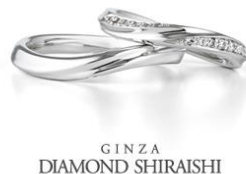
GINZA DIAMOND SHIRAISHI