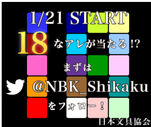
図 3: キャンペーン開始前のバナー banner-before.png