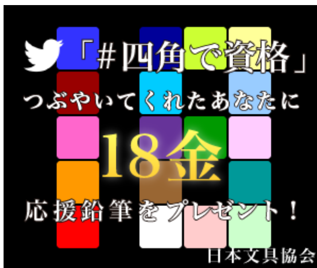
図 4: キャンペーン開始後のバナー banner-after.png